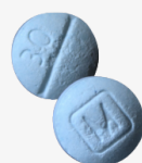
AUTHENTIC oxycodone m30 tablets*

Fake prescription pills are easily accessible and often sold on social media and e-commerce platforms making them available to anyone with a smartphone, including minors.