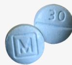
FAKE oxycodone m30 tablets*